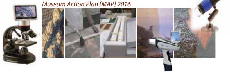
Museum Action Plan [MAP] 2016